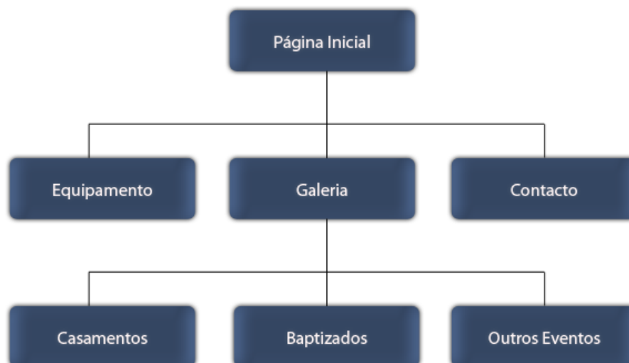
Figura 4: Árvore de navegabilidade (mapa do site)

Neste caso trata-se de um sítio Web de uma empresa de reportagens fotográficas. Na figura 4 podemos ver que a nossa Página Inicial tem três hiperligações para outras páginas: Equipamento, Galeria e Contacto. A página Galeria tem subsecções que permite escolher: Casamentos, Baptizados e Outros Eventos.