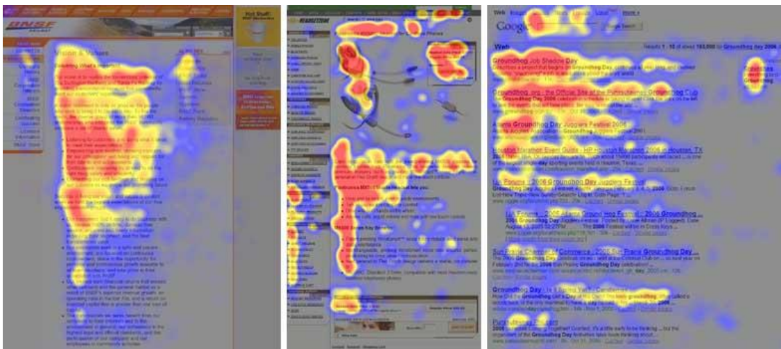
Figura 2 - F-Shaped Pattern