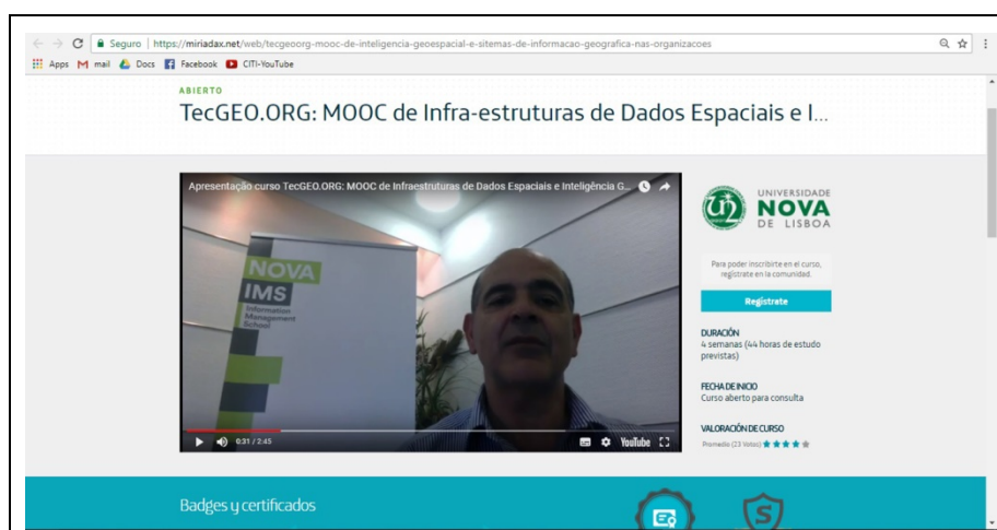
Figura 3: Curso TecGEO.ORG: Infraestruturas de Dados Espaciais e Inteligência Geoespacial

O segundo projeto, da NOVA IMS, foi o curso TecGEO.ORG: Infraestruturas de Dados Espaciais e Inteligência Geoespacial (Figura 3), com uma edição em 2016, com a duração de 4 semanas e 44 horas previstas de estudo. Teve por objetivos dar aos seus participantes uma visão geral e abrangente sobre aspetos relacionados com a organização da informação nas instituições – Infraestruturas de Informação Geográfica – e a sua utilização analítica – GEOINT ou Inteligência Geoespacial, sendo constituído por 3 módulos. Os participantes obtiveram certificado de participação ou certificado de conclusão de acordo com o seu desempenho.