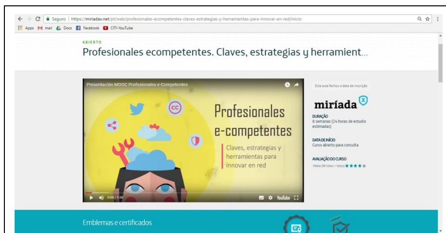
Figura 4: Curso Profissionais e-Competentes: Chaves, Estratégias e Ferramentas para Inovar em Rede

A terceira oferta formativa da NOVA consistiu num curso da iniciativa da Faculdade de Ciências e Tecnologias, em parceria com a Universidade de Málaga, em outubro de 2016, Profissionais e-Competentes: Chaves, Estratégias e Ferramentas para Inovar em Rede (Figura 4), com a duração de 8 semanas, cerca de 24 horas de estudo. O desenho do curso tinha por objetivos proporcionar a estudantes, recém-licenciados, desempregados e mesmo profissionais que o desejassem fazer uma atualização de conhecimentos e aquisição de competências digitais e dos media sociais. Dado que na 1ª edição teve 3700 inscritos, número muito superior ao previsto, os coordenadores, portugueses e espanhóis, decidiram lançar uma 2ª edição em 2017.