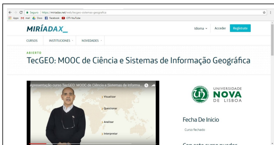
Figura 2: Curso TecGEO - Ciência e Sistemas de Informação Geográfica

de 10 semanas, compreendidas entre maio e junho de 2015, com cerca de 10-12 horas de estudo/semana. A fim de completar a equipa científica, técnica e pedagógica, o IMS convidou o CITI – Centro de Investigação para Tecnologias Interativas, da NOVA FCSH a colaborar no desenho da instrução e na componente multimédia. Este curso teve mais duas edições nos anos seguintes, sendo que na 1ª edição houve um registo de mais de 1000 alunos.